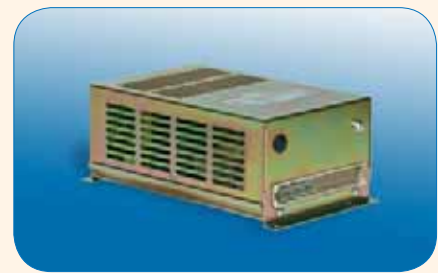
LNCE Wandgehäuse LNCE wall mount

In the LNCE modules, the DC input voltage (24V) is fed to a single frequency square wave generator. The square wave is then transformed upward, rectified and filtered, and supplies the precise output voltage. The output is controlled via pulse-width modulation of the square wave. All versions are continuous short circuit proof and can operate in current or voltage source mode. The output voltage and current are set using the 0...10V analog interface or by means of an external potentiometer, by using the available reference voltage. For acknowledgement of the actual voltage and current, a 0...10 Volt output is provided. To display the current mode of operation (voltage or current source mode), a separate connection is provided. The stand-by input enables switching the output voltage on and off (no forced discharge of the output capacitor). HV connection is provided via a non-detachable HV cable. To connect the control signals and the supply, a 24+7 pin connector according to DIN41612 is provided. The counterplug is part of the extent of delivery. ●